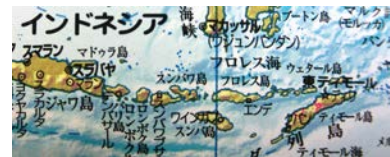
(海底陥没加工なし)